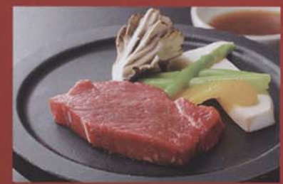
牛ヒレ肉の陶板焼き 2,100円