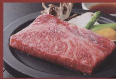
黒毛和牛の陶板焼き 2,625円